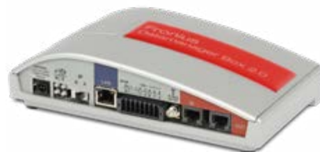
/ Fronius Datamanager Box 2.0