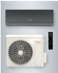
Vitoclima 230-S Dynamic zestaw z jednostką wewnętrzną i pilotem w kolorze czarnym