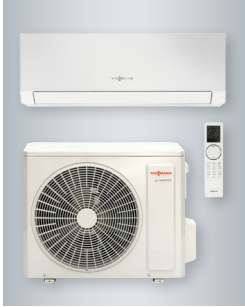
Vitoclima 230-S Dynamic zestaw z jednostką wewnętrzną i pilotem w kolorze białym