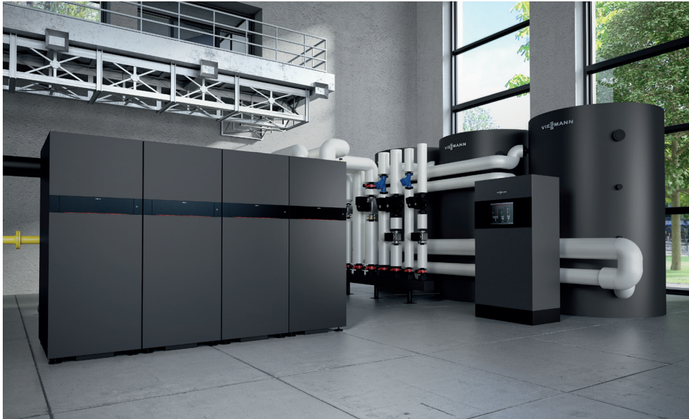
Gazowy kocioł Vitocrossal 300 (typ CI3) w poczwórnej kaskadzie z zasobnikiem buforowym wody grzewczej VitoCell i szafą sterowniczą Vitocontrol (od lewej)

Dojrzała technika kondensacyjna czyni Vitocrossal 300 oszczędnym kotłem grzewczym z szerokim spektrum zastosowań.