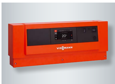
Sterowany pogodowo, cyfrowy regulator kotła i obiegów grzewczych Vitotronic z ekranem dotykowym