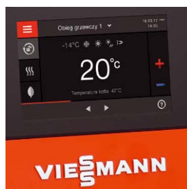
Nowa seria regulatorów Vitotronic umożliwia zdalne sterowanie syste- mem grzewczym