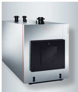
Gazowy kocioł kondensacyjny Vitocrossal 300