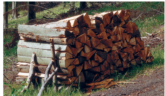
Ogrzewanie drewnem - najbardziej naturalnym paliwem świata

Vitoligno 300-S odznacza się wysoką sprawnością spalania na poziomie do 94,6%, co czyni go najbardziej efektywnym kotłem marki Viessmann w swojej klasie. Dzięki zastosowaniu kontroli spalania z sondą lambda uzyskane zostały bardzo niskie wskaźniki emisji. Zintegrowany system inteligentnego zarządzania zbiornikiem buforowym pozwala oszczędzić do 10% wartości paliwa w sezonie grzewczym.