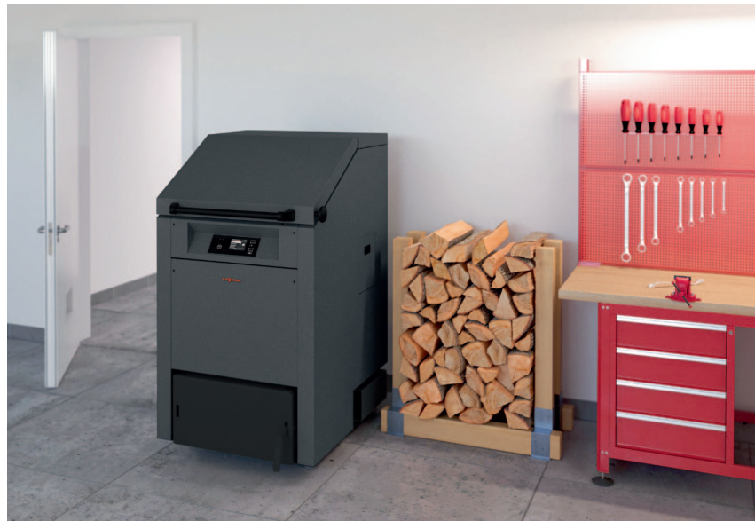
Kocioł Vitoligno 300-S na: drewno kawałkowe, szczapy i resztki drewniane lub brykiety drzewne

Vitoligno 300-S dostępny jest w mocach od 33 do 75 kW. Jako następca kotła Vitoligno 250-S jest on jeszcze bardziej efektywny oraz zapewnia wyższy komfort obsługi. Jest kotłem o szerokim spektrum zastosowania: od domów wielorodzinnych poprzez zakłady przetwórstwa rolniczego oraz drzewnego.