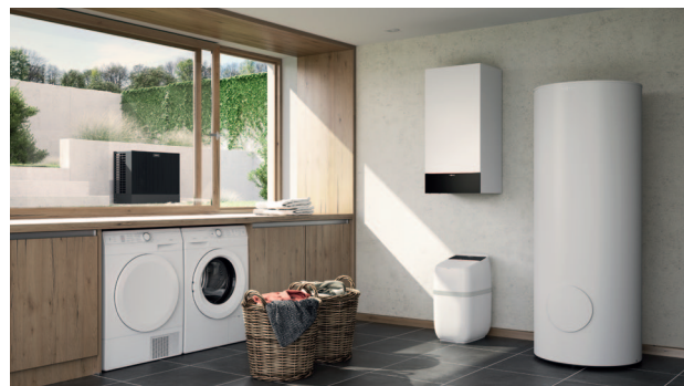
Pompa ciepła powietrze/woda Vitocal 200-S z zainstalowanym pod nią systemem zmiękczenia wody pitnej Vitaset Aqua.