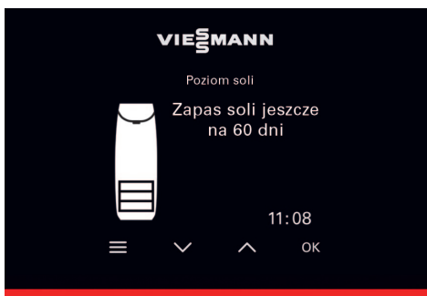
Wyświetlacz i pasek świetlny pokazują informacje o aktualnym stanie pracy urządzenia.

Po uruchomieniu można stację zmiękczącą dodać jako kolejne urządzenie do bezpłatnej aplikacji mobilnej