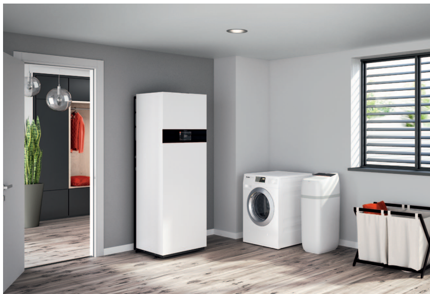
Vitaset Aqua to rozsądne rozwiązanie, które zapewnia zmiękczoną wodę i poprawia efektywność działania przyłączonych urządzeń zasilanych wodą.

Stacje uzdatniania wody Vitaset Aqua zaopatrują gospodarstwa domowe w zmiękczoną wodę oraz chronią instalacje wodne i grzewcze przed zniszczeniem.